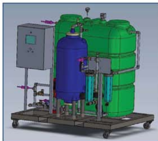
Présentation 3D de l'équipement de recyclage ATLANTE 5+