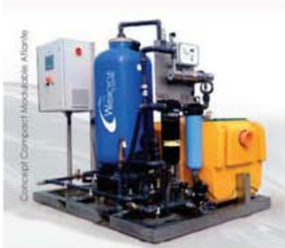
Adaptable Compact Module "Atlante"

ADP impose "zero" discharge of wash waters. In this context, wash water recycling is the most advantageous, economical and ecological solution for SPR.