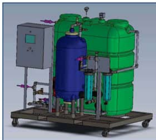
3D Presentation of the ATLANTE 5+ Recycling Unit